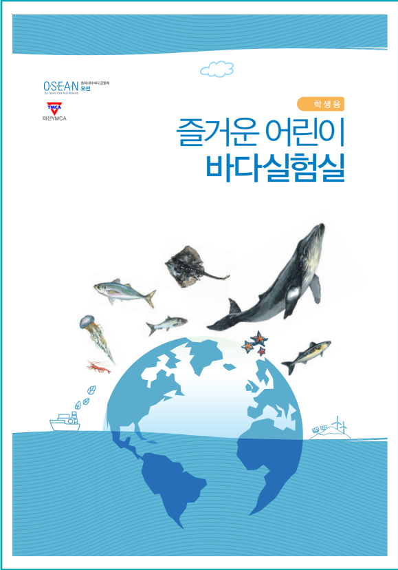
초등학생용 교사용 지도안과 학생용 교재