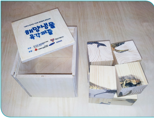
1차시 바다 속 친구가 궁금해요