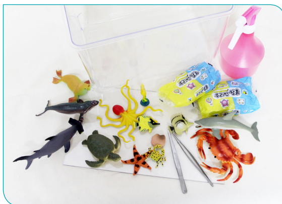
9차시 바다에 쓰레기가 왜 많을까요?