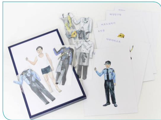
7차시 바다를 좋아하면 직업이 돼요