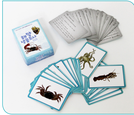
3차시 갯벌 친구를 만나러 가요