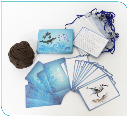
6차시 바다 친구들이 되어보아요